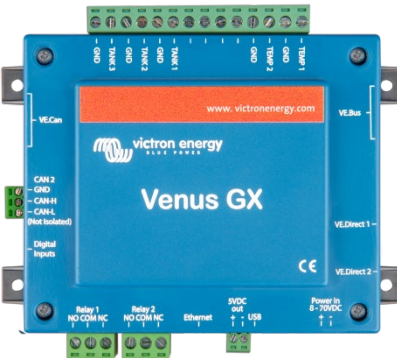
Venus GX mit Steckern