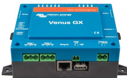
Venus GX Vorderansicht