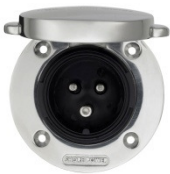
3-pólusú rozsdamentes csatlakozó aljzat