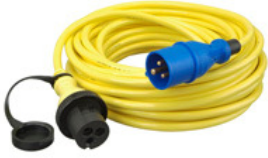
Parti csatlakozó kábel