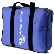
Shore Power Organiser Bag